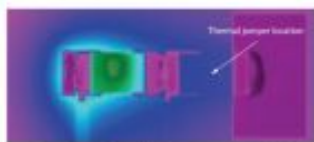
Ceramic Chip Resistor With Thermal Jumper (65.5 °C)

Vľavo je osadená súčiastka zohrievaná pretekajúcim prúdom na 150°C, vpravo rovnaká súčiastka v rovnakých podmienkach, ale jeden jej vývod je pomocou thermal jumper-a pripojený na chladiacu plochu.