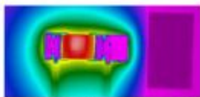
Ceramic Resistor Chip Without Thermal Jumper (188.8 °C)

V datasheete Vishay je uvedený príklad aplikácie nasnímaný tepelnou kamerou (klik na obrázok pre zväčšenie):